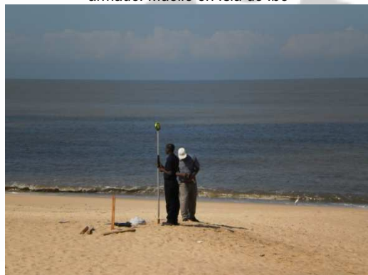
Fig.4: Trabajos de levantamiento topográfico. Playas de Beira