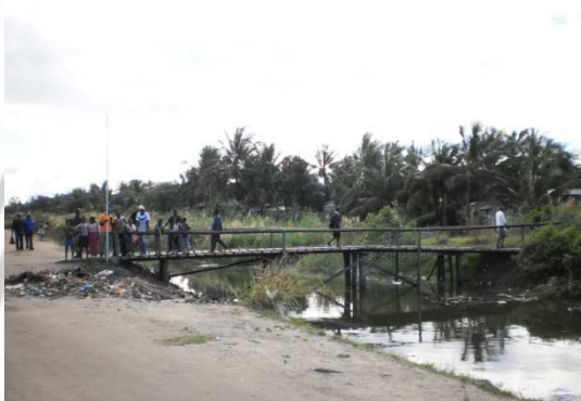
Fig. 7: Puente sobre canales de desagüe. Beira