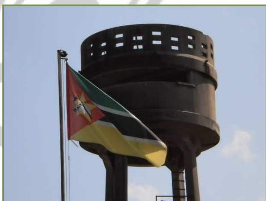
Fig. 1: Depósito de agua. Beira