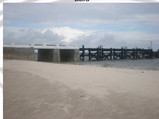
Fig. 8: Estado muelle Isla de Ibo tras la reconstrucción