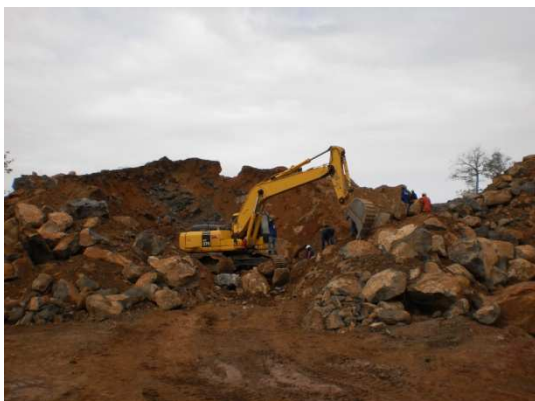
Fig. 5: Cantera, Provincia de Sofala. Mozambique