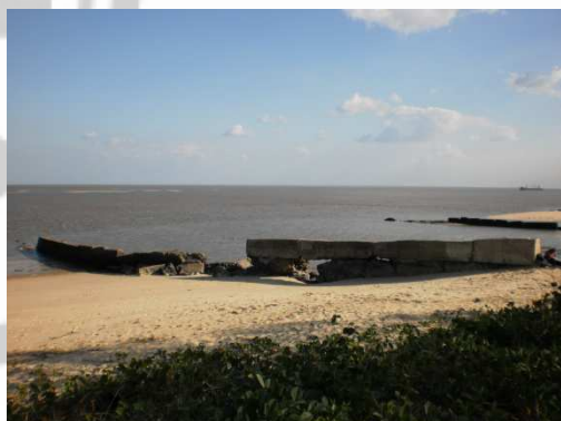
Fig. 3: Situación actual de las playas de Beira