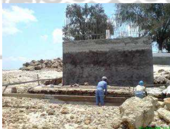
Fig. 2. Reconstrucción de los tajamares en hormigón armado. Muelle en Isla de Ibo